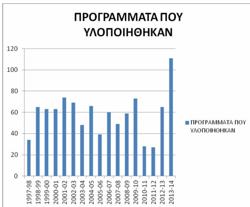
Σχήμα 1: Προγράμματα που υλοποιήθηκαν ανά σχολικό έτος από 1997-2014.

Το έτος έναρξης 1997-98 της Π.Ε στα σχολεία (Δημοτικά και Νηπιαγωγεία) του Ν. Λέσβου, πραγματοποιήθηκαν 34 προγράμματα και αμέσως μετά, το επόμενο σχολικό έτος σχεδόν διπλασιάστηκε ο αριθμός ενώ παρατηρείται μια σχετική σταθερότητα του αριθμού εκπόνησης προγραμμάτων γεγονός που δηλώνει ότι η εκπαιδευτική κοινότητα ήταν έτοιμη να δεχτεί την καινοτόμο δράση. Το σχολικό έτος 2003-2004 παρατηρείται μικρή μείωση των προγραμμάτων της ΠΕ, πιθανότατα λόγω της τέλεσης των Ολυμπιακών Αγώνων στην Ελλάδα και της υλοποίησης προγραμμάτων Ολυμπιακής Παιδείας,