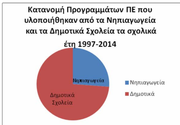
Σχήμα 3: Κατανομή προγραμμάτων ΠΕ που υλοποιήθηκαν από τα Νηπιαγωγεία και τα Δημοτικά Σχολεία τα σχολικά έτη 1997-2014

Η κατανομή αυτή μπορεί αφενός, να αποδοθεί στη μικρή ηλικία των μαθητών του νηπιαγωγείου που δυσχεραίνει τη μελέτη πεδίου και την εισαγωγή ευρύτερα αφηρημένων εννοιών στην εκπαιδευτική διαδικασία και αφετέρου, στον αριθμό διδακτικών τάξεων που αποτελείται το Δημοτικό Σχολείο, γεγονός που το καθιστά ικανό να αναλάβει αρκετά προγράμματα. Από τη μελέτη των σχημάτων 2 & 3 διαπιστώνεται ότι τα Δημοτικά Σχολεία εκπονούν σημαντικά μεγαλύτερο αριθμό προγραμμάτων από τα Νηπιαγωγεία.