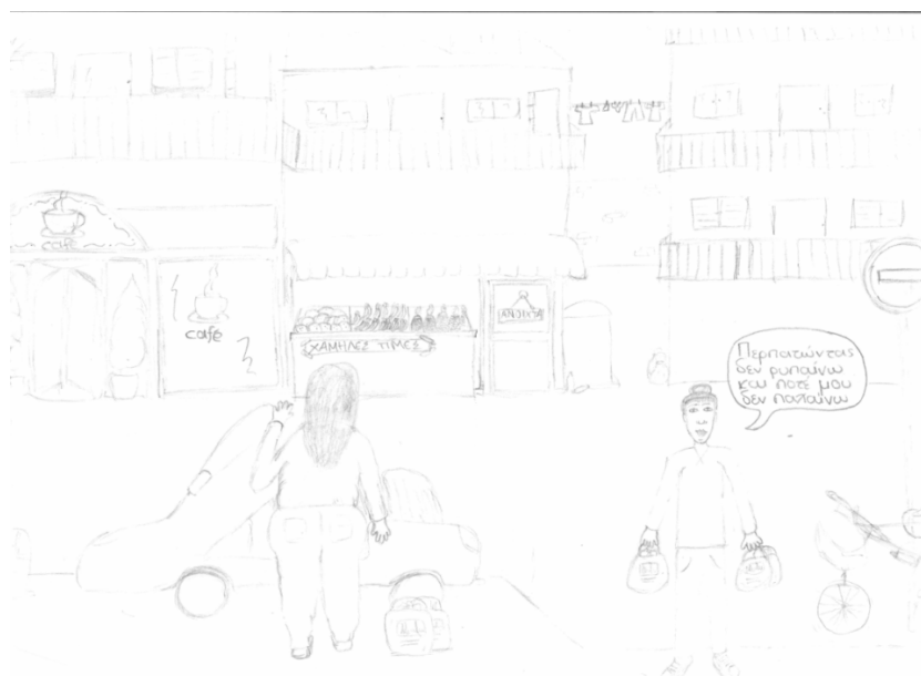
Σχήμα 6: Η ζωγραφιά μας.