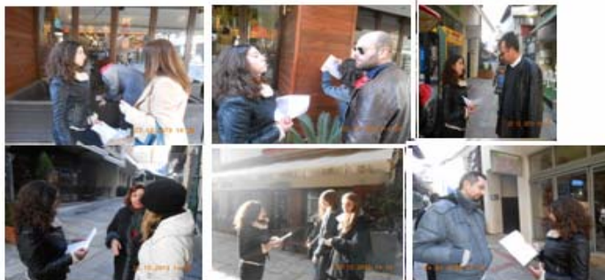
Σχήμα 2: Συνεντεύξεις στο κέντρο της πόλης.

επίλυση των προβλημάτων αυτών, αφού πρώτα μελέτησαν τα μέτρα που λαμβάνονται σε άλλες πόλεις της Ελλάδας και του εξωτερικού. Τα προβλήματα που εντόπισαν μαζί με τις προτάσεις τους για την επίλυσή τους τα παρουσίασαν στο Δήμαρχο Κοζάνης σε συνάντηση που είχαν μαζί του ( http://eribiology.blogspot.gr/2014/01/4-ecomobility-4-ecomobility-2013-2014.html#more ).