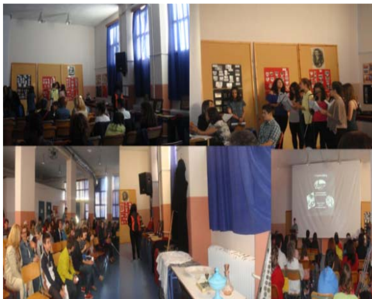
Σχήμα 8: Στιγμιότυπα από τη σχολική εκδήλωση.