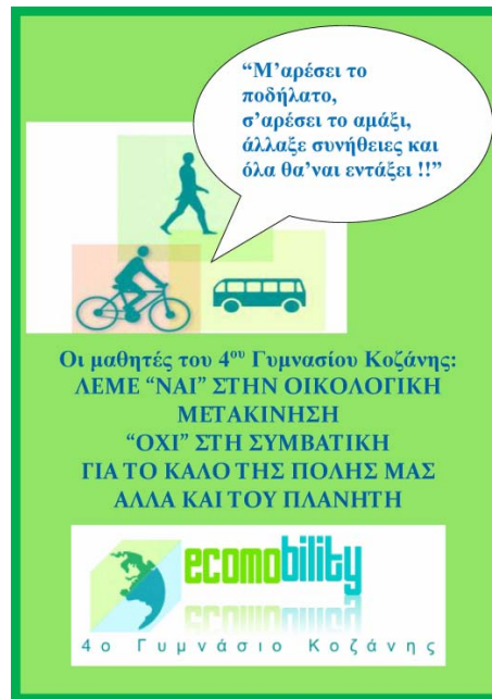
Σχήμα 5: Αφίσα

παρακολούθησαν σεμινάριο μοντάζ από σκηνοθέτη τοπικού τηλεοπτικού σταθμού και δημιούργησαν ένα video με αποσπάσματα από τις δραστηριότητες και συναντήσεις του προγράμματος ( https://www.youtube.com/watch?v=tY-IyKDFs7A ), δημιούργησαν μια ζωγραφιά, που στέλνει το μήνυμα ότι η χρήση ποδηλάτου και το περπάτημα αδυνατίζουν και δε ρυπαίνουν, και παρουσίασαν την εργασία τους σε ειδική εκδήλωση για την εκστρατεία Ecomobility ( http://www.ecomobility.gr/simantikes-protaseis-oikologikis-me/ , http://vimeo.com/86006969 ), για την οποία μάλιστα λάβανε την 5 η θέση πανελλαδικώς, αλλά και στο 2 ο Μαθητικό Περιβαλλοντικό Συνέδριο του δικτύου "Βιώσιμη πόλη: Η πόλη ως πεδίο εκπαίδευσης για την αειφορία" ( http://eribiology.blogspot.gr/2014/05/4-2-10-4-2-ecomobility-5.html#more ).