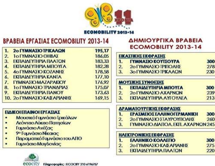
Σχήμα 7: 5 η θέση στην εκστρατεία Ecomobility.

Στο πλαίσιο του προγράμματος το σύνολο των μαθητών του προγράμματος πραγματοποίησε τις ακόλουθες δράσεις: