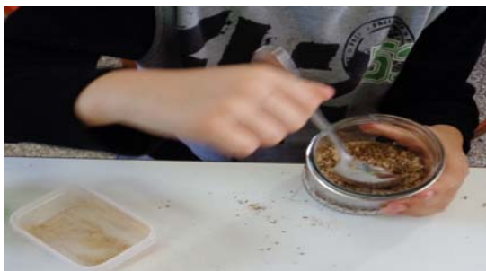
Εικόνα 16: Αρωματίζουμε αλάτι

Αρωματικό Αλάτι: Προσθέσαμε μπαχαρικά και βότανα σε ένα βαζάκι, εναλλάσσοντας το αλάτι και τα βότανα σε δύο ή τρεις στρώσεις για να περάσει η γεύση σε όλους τους κόκκους του αλατιού. Κλείσαμε καλά το βάζο με το καπάκι του και το κουνήσαμε δυνατά. Το αφήσαμε για 3-4 εβδομάδες σε σκοτεινό μέρος. Όταν ήταν έτοιμο το βάλουμε σε μύλο και το τρίναμε σε φέτες ψωμιού, ντομάτας ή σε οποιοδήποτε φαγητό θέλαμε να δώσουμε γεύση.