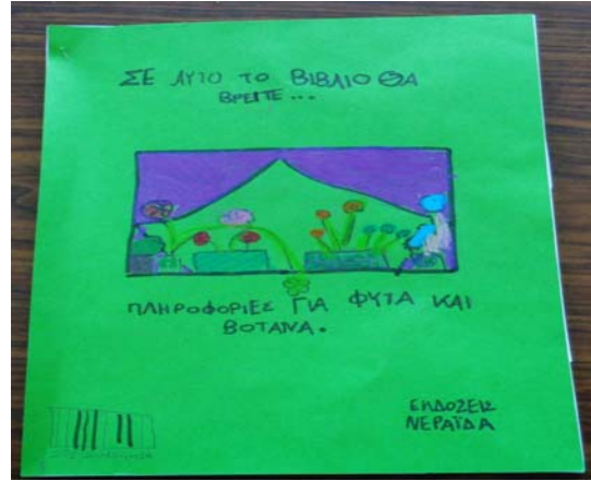
Εικόνα 8: Βιβλίο με παρατηρήσεις για την ανάπτυξη των φυτών μας

Αποξηράναμε δίκταμο και φτιάξαμε ροφήματα με βότανα. Απολαύσαμε το τσάι μας με τη συντροφιά των δύο άλλων τμημάτων της Δευτέρας τάξης. Το συνοδεύσαμε με λουκουμάδες και με ζυμωτό ψωμί με προζύμι. Νοστιμίσαμε τις φετούλες του ψωμιού με αρωματικό ελαιόλαδο και αλάτι δικής μας παραγωγής.