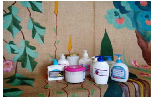
Εικόνα 19: Σαπούνι ελαιολάδου με βότανα

Η κηραλοιφή μας με μελισσοκέρι και βότανα μας ενθουσίασε όλους. Για την κηραλοιφή που φτιάξαμε στην τάξη, στα 10 γραμμάρια μελισσοκέρι βάλουμε 75 γραμμάρια λάδι. Το λάδι το είχαμε αρωματίσει με βανίλια Μαδαγασκάρης και όταν το κατεβάσαμε από τη φωτιά προσθέσαμε αιθέριο έλαιο από λεβάντα.