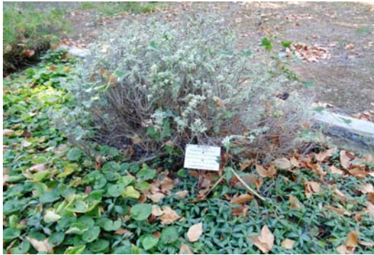
Εικόνα 3: Βοτανικός κήπος