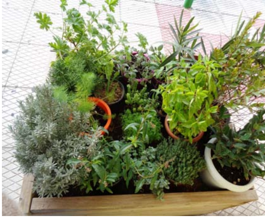
Εικόνα 7: Τα φυτά μας