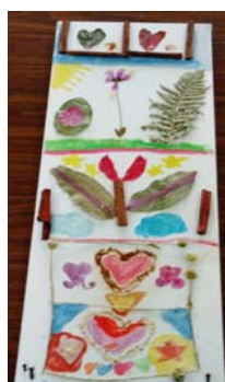
Εικόνα 25: Πίνακας ζωγραφικής με φυτά