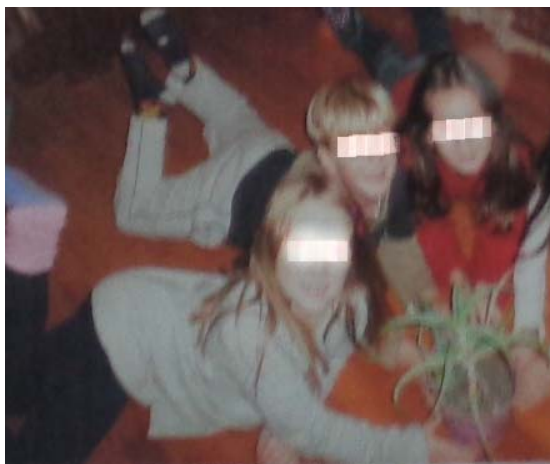
Εικόνα 1: Ομάδα σε δράση

Στη συνέχεια για να υλοποιήσουμε το περιβαλλοντικό μας πρόγραμμα, δημιουργήσαμε ομάδες εργασίας των τριών ή τεσσάρων μαθητών. Για τη σύσταση των ομάδων λάβαμε υπόψιν μας τα ενδιαφέροντα και τις προτιμήσεις τους. Οι μαθητές κατάφεραν να αναπτύξουν πνεύμα συνεργασίας, έμαθαν να εργάζονται υπεύθυνα και συλλογικά και καλλιέργησαν την κοινωνικότητα μέσα από την ομαδοποίηση και την κατανομή εργασιών, για τη δημιουργία βιβλίων φυτολογίων και εικαστικών συνθέσεων.