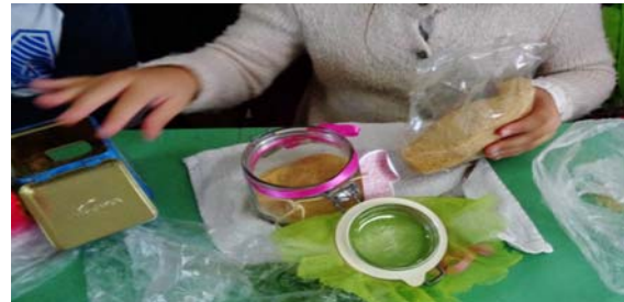
Εικόνα 15: Αρωματίζουμε καστανή ζάχαρη

Αρωματικό Αλάτι: Προσθέσαμε μπαχαρικά και βότανα σε ένα βαζάκι, εναλλάσσοντας το αλάτι και τα βότανα σε δύο ή τρεις στρώσεις για να περάσει η γεύση σε όλους τους κόκκους του αλατιού. Κλείσαμε καλά το βάζο με το καπάκι του και το κουνήσαμε δυνατά. Το αφήσαμε για 3-4 εβδομάδες σε σκοτεινό μέρος. Όταν ήταν έτοιμο το βάλουμε σε μύλο και το τρίναμε σε φέτες ψωμιού, ντομάτας ή σε οποιοδήποτε φαγητό θέλαμε να δώσουμε γεύση.