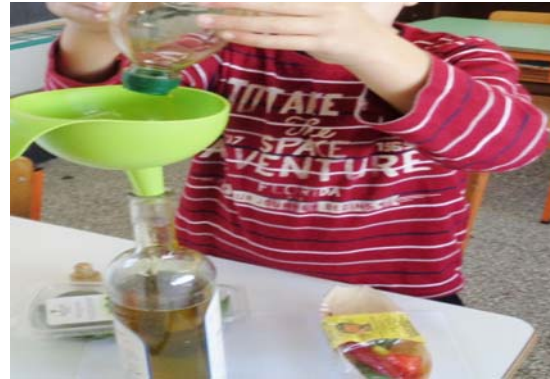
Εικόνα 13: Αρωματίζουμε ελαιόλαδο

Αρωματισμένη ζάχαρη: Σε ένα βαζάκι βάλουμε ζάχαρη και φύλλα αρμπαρόριζας σε στρώσεις. Κλείσαμε το βάζο και το αφήσαμε σε δροσερό μέρος για περίπου δέκα μέρες. Κατά διαστήματα κουνούσαμε το βάζο ή ανακατεύαμε με κουτάλι για να αρωματιστεί όλη η ζάχαρη.