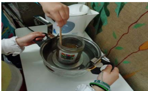
Εικόνα 20: Λιώνουμε το μελισσοκέρι

Η κηραλοιφή μας με μελισσοκέρι και βότανα μας ενθουσίασε όλους. Για την κηραλοιφή που φτιάξαμε στην τάξη, στα 10 γραμμάρια μελισσοκέρι βάλουμε 75 γραμμάρια λάδι. Το λάδι το είχαμε αρωματίσει με βανίλια Μαδαγασκάρης και όταν το κατεβάσαμε από τη φωτιά προσθέσαμε αιθέριο έλαιο από λεβάντα.