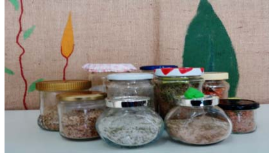
Εικόνα 17: Αρωματικό αλάτι

Φτιάξαμε ένα μοσχομυριστό, υγρό, οικολογικό σαπούνι για το σώμα, τα μαλλιά, τα χέρια, τα πιάτα, το πάτωμα και για οποιαδήποτε άλλη χρήση. Χρησιμοποιήσαμε 100 ml σαπούνι ελαιολάδου σε νιφάδες, περίπου 400 ml νερό, 1 βότανο, 1 κουταλιά καστανή ζάχαρη, 1 αιθέριο έλαιο της αρεσκείας μας, 1 κουταλάκι λάδι.