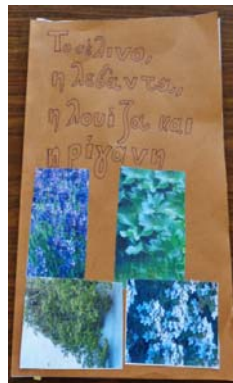
Εικόνα 26: Παραμύθι με φυτά