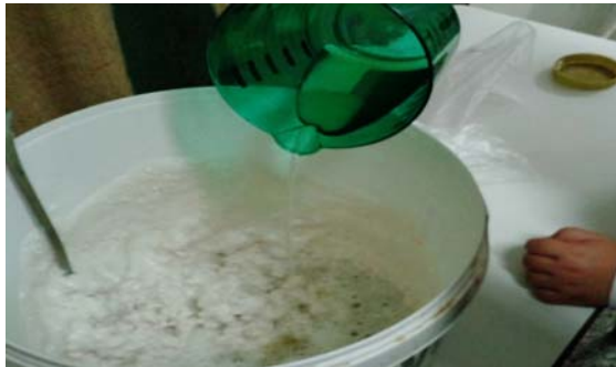
Εικόνα 18: Φτιάχνουμε σαπούνι

Φτιάξαμε ένα μοσχομυριστό, υγρό, οικολογικό σαπούνι για το σώμα, τα μαλλιά, τα χέρια, τα πιάτα, το πάτωμα και για οποιαδήποτε άλλη χρήση. Χρησιμοποιήσαμε 100 ml σαπούνι ελαιολάδου σε νιφάδες, περίπου 400 ml νερό, 1 βότανο, 1 κουταλιά καστανή ζάχαρη, 1 αιθέριο έλαιο της αρεσκείας μας, 1 κουταλάκι λάδι.