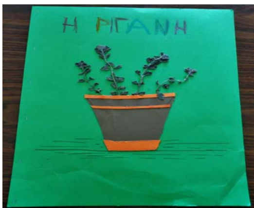
Εικόνα 22: Εξώφυλλο βιβλίου

Τα μέλη των ομάδων συνεργάστηκαν και δημιούργησαν 22 βιβλία αρωματικών φυτών και βοτάνων. Ασχολήθηκαν με μερικά από τα πιο γνωστά αρωματικά φυτά και βότανα: Άνηθο, Μέντα, Ρίγανη, Βασιλικό, Σέλινο, Δάφνη, Φασκόμηλο, Δενδρολίβανο, Δίκταμο, Δυόσμο, Θυμαρί, Λεβάντα, Μαϊντανό, Μάραθο, Μαντζουράνα, Στέβια, Αλόη, Τσάι του βουνού, Λουίζα, Σκόρδο, Αρμπαρόριζα.