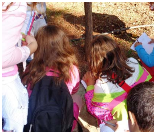
Εικόνα 2: Καταγραφή πληροφοριών

Επισκεφθήκαμε το βοτανικό κήπο και γνωρίσαμε από κοντά τα είδη των φυτών.