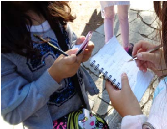
Εικόνα 5: Καταγραφή πληροφοριών

Χρησιμοποιήσαμε το σημειωματάριό μας, για τη συλλογή πληροφοριών από το οικογενειακό περιβάλλον, από ειδικούς, τη βιβλιογραφία και το διαδίκτυο.