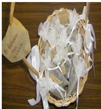
Εικόνα 24: Πουγκιά με βότανα

Εκτός από τη δημιουργία βιβλίων οι μαθητές συνεργάστηκαν και δημιούργησαν φυτολόγια, παραμύθια, συλλογές και εικαστικές συνθέσεις με βότανα.