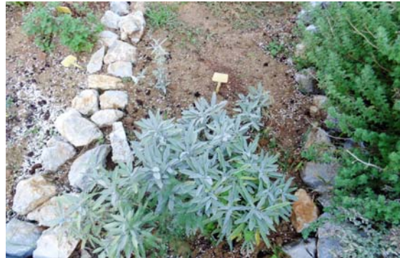
Εικόνα 4: Βοτανικός κήπος

Χρησιμοποιήσαμε το σημειωματάριό μας, για τη συλλογή πληροφοριών από το οικογενειακό περιβάλλον, από ειδικούς, τη βιβλιογραφία και το διαδίκτυο.