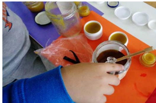
Εικόνα 21: Προσθέτουμε τη λεβάντα

Όλες αυτές οι δράσεις βοήθησαν τα παιδιά να εκτιμήσουν τη σημασία των αρωματικών φυτών στην υγεία και στην ποιότητα ζωής και να τα συμπεριλάβουν στη διατροφή τους. Αποκτήσαν περιβαλλοντική συνείδηση, έμαθαν πως η προστασία του περιβάλλοντος δεν αφορά μόνο τους ειδικούς και τους επιστήμονες, αλλά όλους μας. Επίσης συνειδητοποίησαν τους κινδύνους από τα διάφορα χημικά τα οποία έχουν γίνει μέρος της καθημερινής μας ζωής και ευαισθητοποιήθηκαν στη χρήση φιλικών