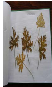
Εικόνα 27: Σελίδα από φυτολόγιο

Ασχοληθήκαμε επίσης με γαιτροσόφια και τη συλλογή και ανάλυση ποιημάτων, παροιμιών, μαντινάδων, αιγιμάτων, εκφράσεων, εικόνων που αναφέρονται στα αρωματικά φυτά και βότανα. Ενδεικτικά αναφέρουμε μερικές εκφράσεις και παροιμίες: “Κολοκύθια με τη ρίγανη, Χώνεται παντού σαν μαϊντανός, Σκόρδα στα μάτια σου, Βασιλικός κι αν μαραθεί τη μυρωδιά την έχει” και δύο στίχους από ένα κρητικό έμμετρο ποίημα που λέγεται «Σαρανταβότανο» γιατί έχει μέσα σαράντα βότανα: “Φύλλα συκιάς κι αμυγδαλιάς και φύλλα μαντζουράνας, φλισκούνι που μοσκοβολά σαν κόρφος κάθε μάνας” (Παλαιοχώρι Λέσβου, 2013).