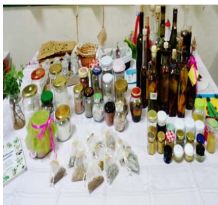
Εικόνα 29: Προϊόντα με αρωματικά φυτά