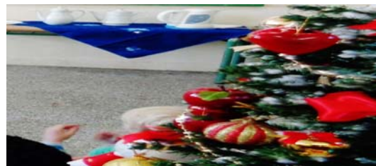
Εικόνα 10: Τσάι με βότανα στην τάξη

Συντηρήσαμε δυόσμο σε ελαιόλαδο: Γεμίσαμε ένα βαζάκι με δυόσμο και ρίξαμε λάδι μέχρι να σκεπαστεί ο δυόσμος. Βάλουμε και διάφορα πιπέρια μέσα. Χρησιμοποιούμε τα φύλλα σε συνταγές με δυόσμο. Όταν τελειώσουν τα φύλλα, το λάδι θα το χρησιμοποιήσουμε σε σαλάτες ή στο μαγείρεμα.