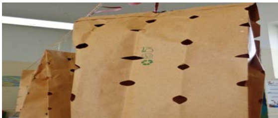
Εικόνα 9: Αποξήρανση δίκταμου

Αποξηράναμε δίκταμο και φτιάξαμε ροφήματα με βότανα. Απολαύσαμε το τσάι μας με τη συντροφιά των δύο άλλων τμημάτων της Δευτέρας τάξης. Το συνοδεύσαμε με λουκουμάδες και με ζυμωτό ψωμί με προζύμι. Νοστιμίσαμε τις φετούλες του ψωμιού με αρωματικό ελαιόλαδο και αλάτι δικής μας παραγωγής.