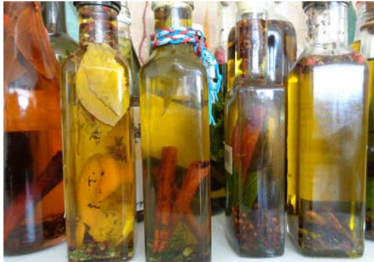
Εικόνα 12: Αρωματισμένο ελαιόλαδο

Αρωματισμένο ελαιόλαδο : Σε ένα γυάλινο μπουκάλι με ελαιόλαδο βάλουμε πολλά βότανα και μπαχαρικά μαζί, όπως ρίγανη, θυμάρι, δυόσμο και βασιλικό. Το φυλάξαμε σε ένα σκοτεινό μέρος. Μετά από 3-4 εβδομάδες είχαμε ένα άριστο αρωματικό ελαιόλαδο για οποιαδήποτε χρήση.