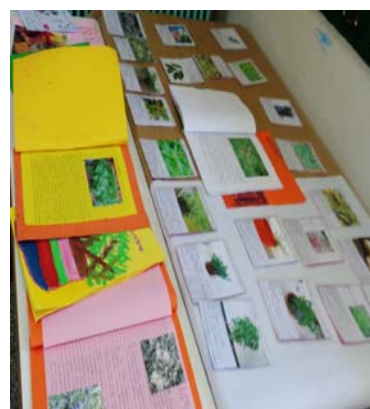
Εικόνα 30: Βιβλία αρωματικών φυτών και βοτάνων