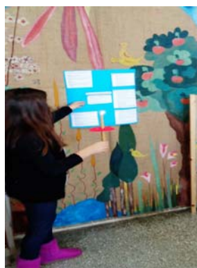
Εικόνα 28: Παρουσίαση του Καταστατικού χάρτη της γης

Ο Καταστατικός Χάρτης της Γης είναι μια διακήρυξη θεμελιωδών ηθικών αρχών για την οικοδόμηση μιας δίκαιης, βιώσιμης και ειρηνικής παγκόσμιας κοινωνίας στον 21ο αιώνα. Επιδιώκει να εμπνεύσει όλους τους ανθρώπους με μια νέα αίσθηση παγκόσμιας αλληλεξάρτησης και κοινής ευθύνης για την ευημερία ολόκληρης της ανθρώπινης οικογένειας, της μεγαλύτερης κοινότητας της ζωής και των μελλοντικών γενεών. Είναι ένα όραμα ελπίδας και μια πρόσκληση για δράση (Η πρωτοβουλία του Καταστατικού Χάρτη της Γης στην Ελλάδα, χ.η.).