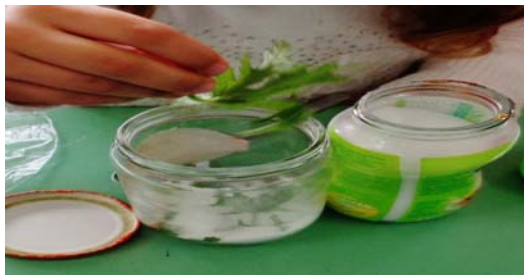
Εικόνα 14: Αρωματίζουμε στέβια

Αρωματισμένη ζάχαρη: Σε ένα βαζάκι βάλουμε ζάχαρη και φύλλα αρμπαρόριζας σε στρώσεις. Κλείσαμε το βάζο και το αφήσαμε σε δροσερό μέρος για περίπου δέκα μέρες. Κατά διαστήματα κουνούσαμε το βάζο ή ανακατεύαμε με κουτάλι για να αρωματιστεί όλη η ζάχαρη.