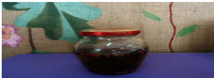
Εικόνα 11: Δυόσμος σε ελαιόλαδο

Συντηρήσαμε δυόσμο σε ελαιόλαδο: Γεμίσαμε ένα βαζάκι με δυόσμο και ρίξαμε λάδι μέχρι να σκεπαστεί ο δυόσμος. Βάλουμε και διάφορα πιπέρια μέσα. Χρησιμοποιούμε τα φύλλα σε συνταγές με δυόσμο. Όταν τελειώσουν τα φύλλα, το λάδι θα το χρησιμοποιήσουμε σε σαλάτες ή στο μαγείρεμα.