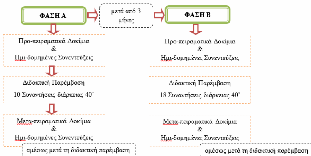
Σχήμα 1: Τα στάδια της ερευνητικής διαδικασίας κατά τη διάρκεια των δύο φάσεων.

Καθ' όλη τη διάρκεια των δραστηριοτήτων, η δράση των μαθητών στις ομάδες τους βιντεοσκοπήθηκε. Συνολικά, βιντεοσκοπήθηκαν επτά ομάδες κατά τη διάρκεια των 10 σαραντάλεπτων συναντήσεων στην πρώτη φάση και των 18 σαραντάλεπτων συναντήσεων στη δεύτερη φάση. Παράλληλα, γινόταν συμπλήρωση ημερολογίου του ερευνητή για κάθε ομάδα μαθητών και τήρηση αναστοχαστικού ημερολογίου από κάθε ομάδα μαθητών για συγκεκριμένες δραστηριότητες. Το Σχήμα 1 παρουσιάζει τον ερευνητικό σχεδιασμό που ακολουθήθηκε κατά τη διάρκεια των δύο φάσεων της παρούσας έρευνας.