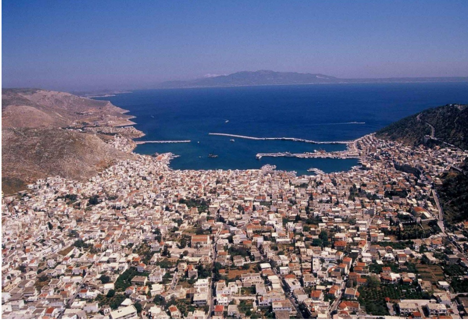
Σχήμα-3: Αεροφωτογραφία της Πόθιας (αρχές της δεκαετίας 2000)