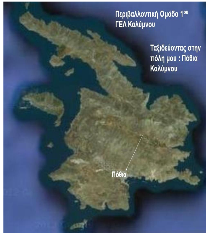
Σχήμα-1: Η θέση της Πόθιας στην Κάλυμνο

Στη συνέχεια αυτό, όπως και ολόκληρο το νησί, πέρασε στα χέρια των Τούρκων, όπου παρέμεινε μέχρι το 1912. Το 1912 καταλήφθηκε από τους Ιταλούς. Το 1948 η Κάλυμνος ενσωματώθηκε μαζί με τα υπόλοιπα νησιά της Δωδεκανήσου στην Ελλάδα (Ιστορία και Πολιτισμός της Καλύμνου 1997, Κουτελλάς, 2006).