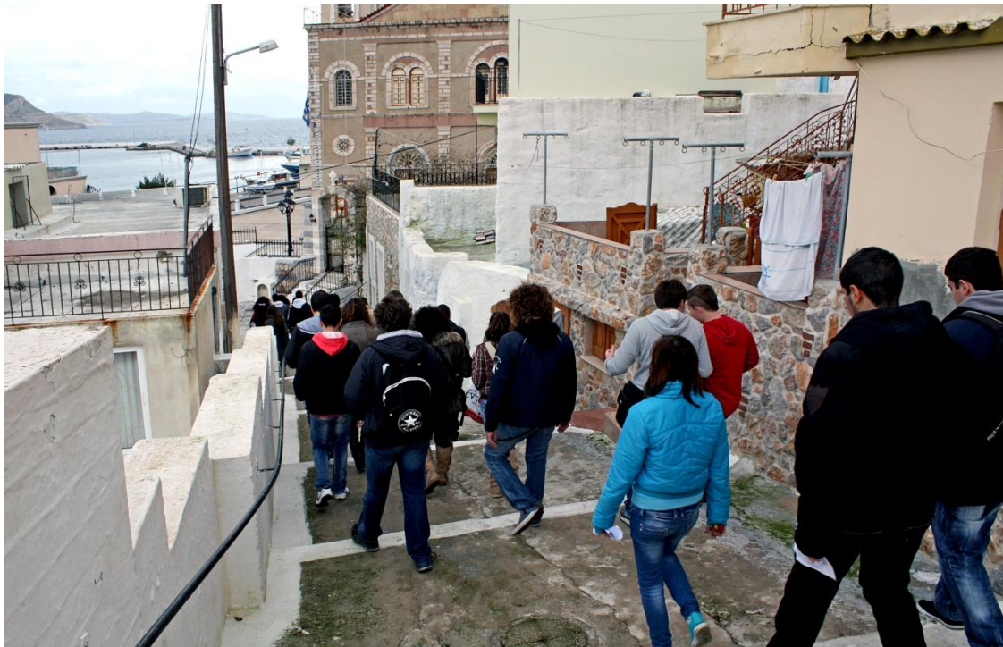
Σχήμα-5: Η ομάδα σε δράση (μαράσι Αγίου Νικολάου)